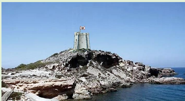
Recreación de la última torre de San Antonio de Cabo de Palos reconstruida en el S. XVII.