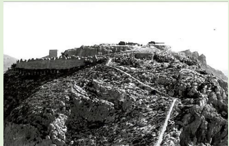
la Fábrica de Trubia.