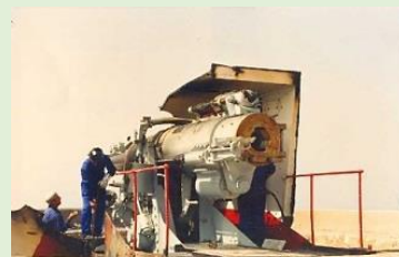
Imagen del desguace de una de las piezas de Aguilones en 1995

Esta batería quedó fuera de servicio en el año 1994 por la aplicación del Plan Norte, y posteriormente fueron desartilladas sus piezas para chatarra en 1995.